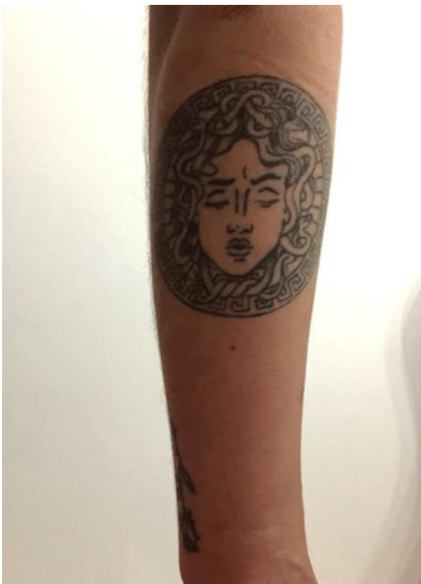
Imaxe 8. Medusa de Versace en estilo fine line

Todo hai que dicilo, eu tamén teño estereotipos metidos na cabeciña. “Complexo de pobre” denominámolo miña parella e mais eu un sábado á noite. Podería dicir que é o mesmo ao que fai referencia Freire cando di que a persoa oprimida vive na dualidade de ser oprimida e opresora, tamén porque quere parecerse a quen oprime, pensando (erroneamente) que así se liberará da súa condición de opresión. E é o mesmo que quixen poñer na pel coa Medusa de Versace (Imaxe 8). Porque os erros, para remedialos, primeiro hai que asumilos.