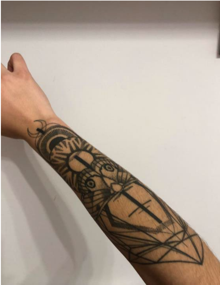
Imaxe 7. Mandala con aveláña en estilo xeométrico

Supoño que ás veces é normal pensar que vaia asco de vida. Que unha tras outra. Ademais, despois de catro anos traballando na hostalaría dinme de conta da maldade da xente. A ver, non é maldade, son prexuizos.