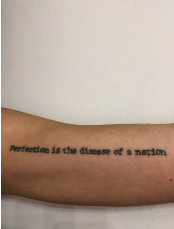
Imaxe 4. "Perfection is the disease of the nation" en estilo fine line

A primeira vez que te miras ao espello e te ves guapa é como cando fagas dezoito anos e che piden o DNI no súper.