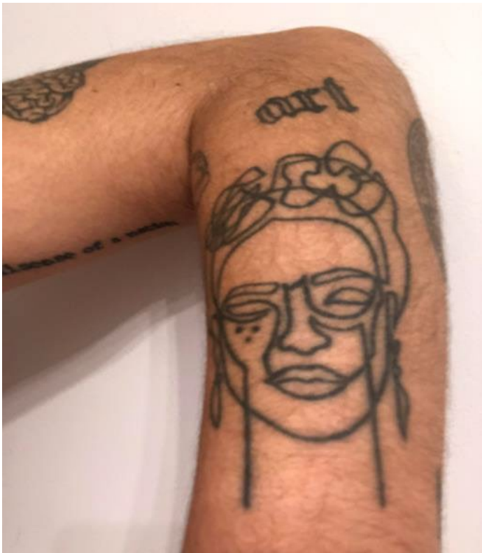
Imaxe 1. Frida Kahlo en estilo fine line

Todas esas historias, dende a yaya ata madriña e mamá, gárdoas con moito agarimo nunha Frida Kahlo que ten os lunares da miña nai (Imaxe 1). E únenos o índice esquerdo, onde todas levamos o símbolo da muller, representando a forza, a sororidade (Imaxe 2).