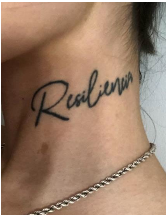
Imaxe 3. Resiliencia en estilo fine line

E falando de resiliencia tamén coñezo outro caso dunha moza que algún día decidiu poñerse calcetíns no sostén. Que por casualidade entrou nunha web chamada Ana y Mía e probou a poñerse un folio A4 na cintura ata que conseguiu que a cintura non se vira. Que con intención, espallaba a comida no prato para semellar que comía máis do que facía. Que se caía cada dous por tres porque non tiña como manterse en pé, pero