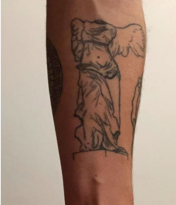
Imaxe 5. Victoria de Samotracia estilo fine line